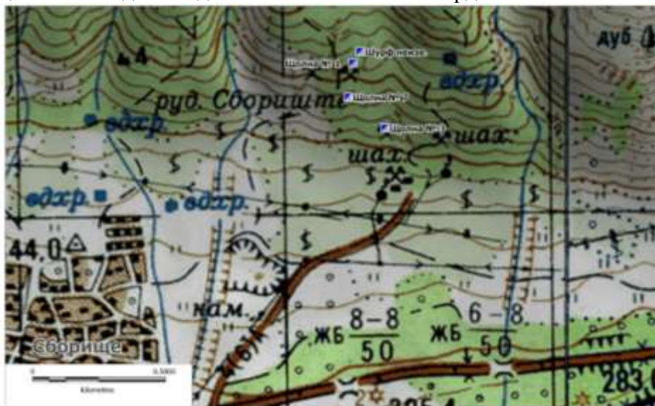
Фигура 1. Обзорна карта на района

Базата (временното строителство) се предвижда да осигури предвидените дейности за всички подобекти. Площадката се ситуира на площадката пред шахта 3 (Фигура 2). Ще се използват горски пътища и пътния достъп до шахта 3. Базата е с координати: 42°41'30.17"N; 25°59'26.19"E.