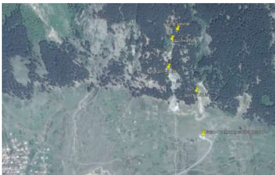
Фигура 2. Ситуиране на площадката за временно строителство